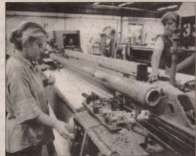
Újszegeden ismét használják a kenderet.

Azután szép lassan elkezdtek csörgedezni az üzleti ajánlatok: az egykori államközi szerződések helyét mára átvette a „gyapotbárok” kötött megállapo-