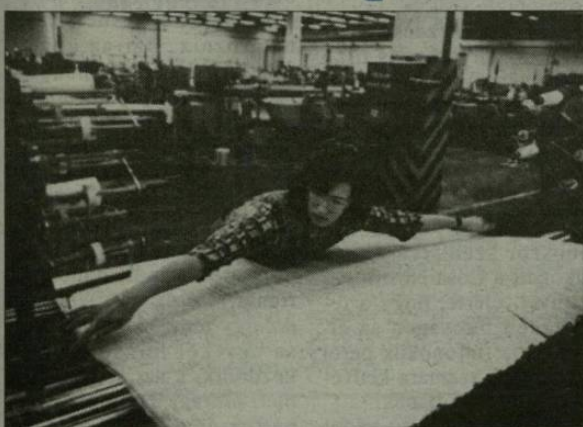
Újszegeden ismét használják a kendert.

– Mi volt a szerencsénk? Szerintem nem jó a kérdés. Tudja, az elmúlt években rajtam röhögött a szakma: a Széll szeret Taskentbe járni! Szeretted a fene, én Ameri-kában mindig jobban érez-tem magam, csak éppen látni kellett, hogy ebben az ipar-ágban a keletiek nélkül nem jutunk messzire.