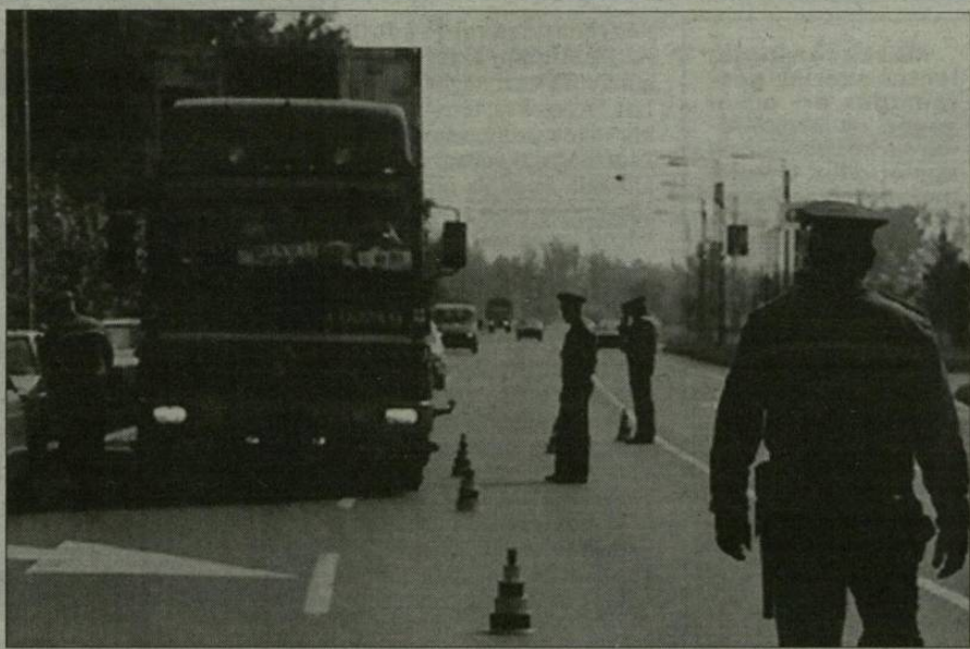
Tegnap reggel nyolctól déli egy óráig tartott a rendőrség Csongrád megyei közbiztonsági akciója.