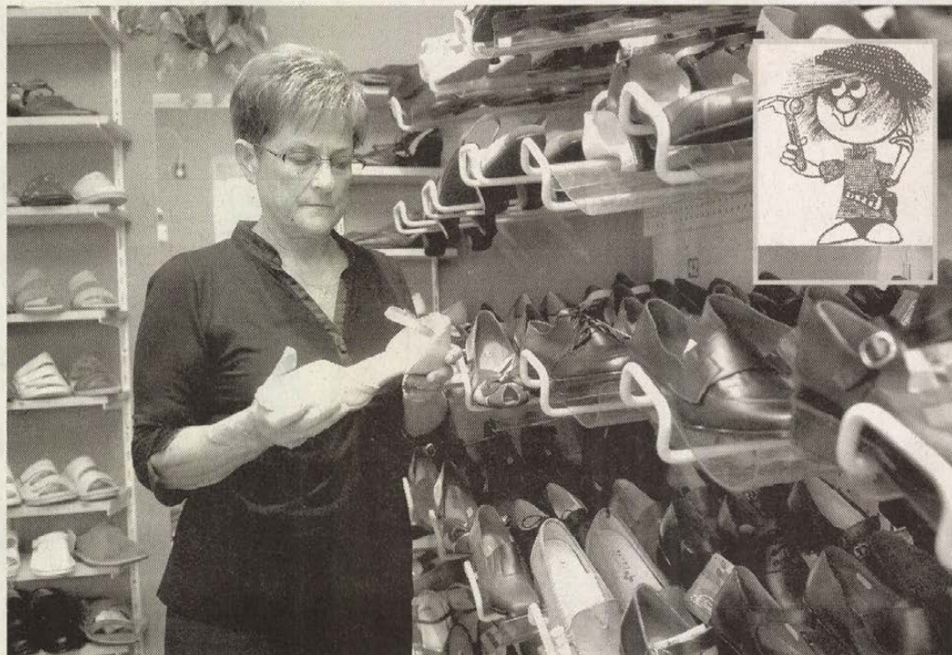
A Tisza Cipőboltban továbbra is a legjobb minőségű magyar termékekkel forgalmazzák

A kínálat pedig igen bőséges. Főként utcai cipőkből válogathatnak a vásárlók, de a boltban megtalálható a sokak által keresett klasszikus kék-fehér csíkos papucs is. Az átlagostól eltérő lábmérettel megáldott vásárló is talál a lábára valót. Női cipőket 33-44-es méretig árulnak, a férfi lábbeliket pedig 37-50-esig. Mindennapi használathoz és alkalmi viselethez egyaránt talál mindenki megfelelőt. Gyermek számára a Tisza cipőbolt az egyetlen olyan szekszárdi üzlet, ahol kapható döntött sarkú Szamos 35-ig, illetve a cég más termékei 20-40-es méretig.