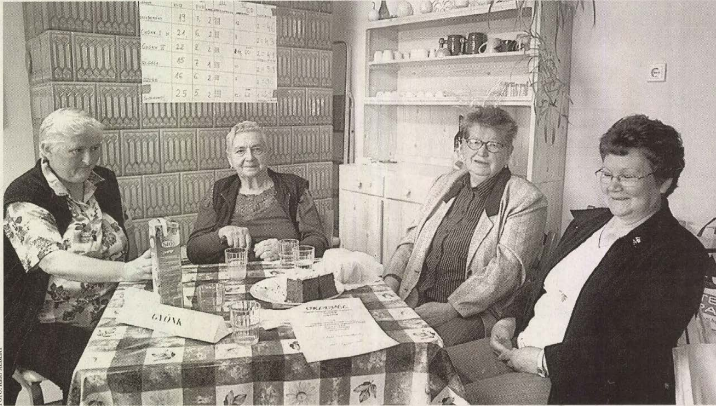
A szakadati vetélkedőt hazai pályán a szakadatiak nyerték, második a gyönkiek (képünkön), harmadik a diósberényiek csapata lett

IDŐSEK NAPJA Szépkorúaknak szerveztek szellemi tornát