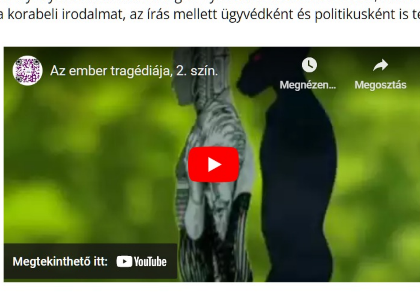
Az ember tragédiájának második színe Jankovics Marcell víziójában

Madách Imre 1823-ban született középnemesi családban, amely a 13. századig tudta visszavezetni a családfáját. Ősei az Árpád-házi királyoktól kaptak nemesi rangot és földbirtokokat. Anyanyelve mellett hat idegen nyelven beszélt tökéletesen, kiválóan ismerte a klasszikus és a korabeli irodalmat, az írás mellett ügyvédként és politikusként is tevékenykedett.