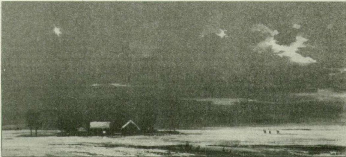
Lázár Pál festménye