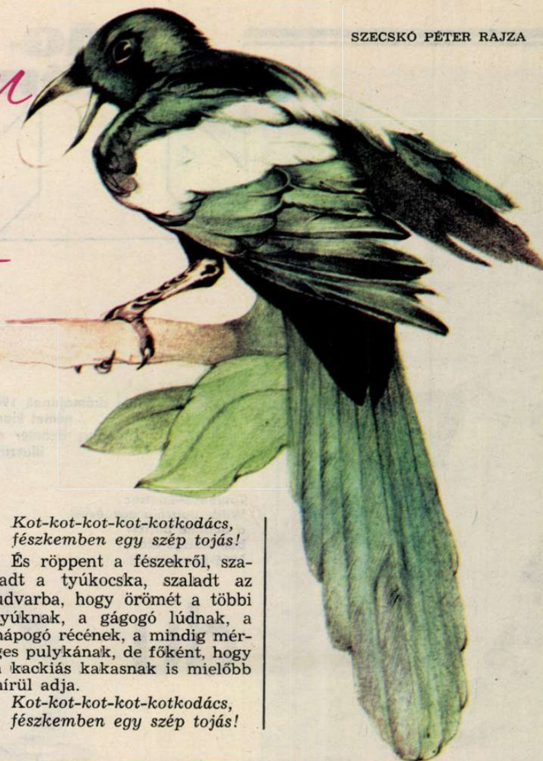
SZECSKÓ PÉTER RAJZA

Am amikor a legeslegelő tyúkocska nagy boldogan a legeslegelő tojást megtojta, örömeiben elkezdett kotkodálni.