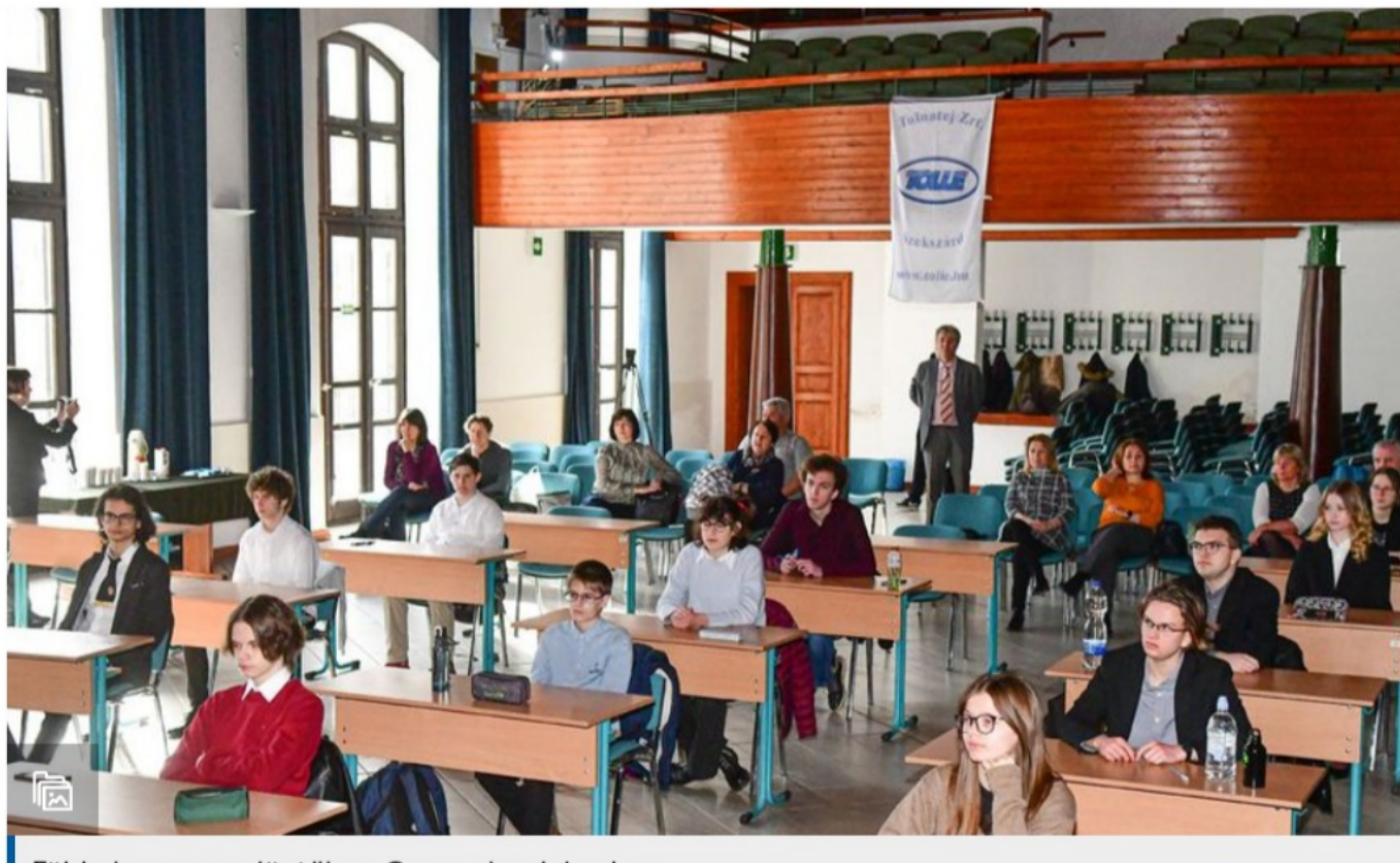
Földrajzverseny döntője a Garay gimnáziumban

A zsűriben ez alkalommal is helyet foglalt dr. Gyuricza László, a PTE TTK Földrajzi és Földtudományi Intézete Turizmus Tanszékének docense, dr. Kovács János, a PTE TTK Földrajzi és Földtudományi Intézete Földtani és Meteorológiai Tanszékének tanszékvezető egyetemi tanára és Gerendásné Szabados Tímea, a pécsi Leőwey Klára Gimnázium földrajz-német szakos tanára.