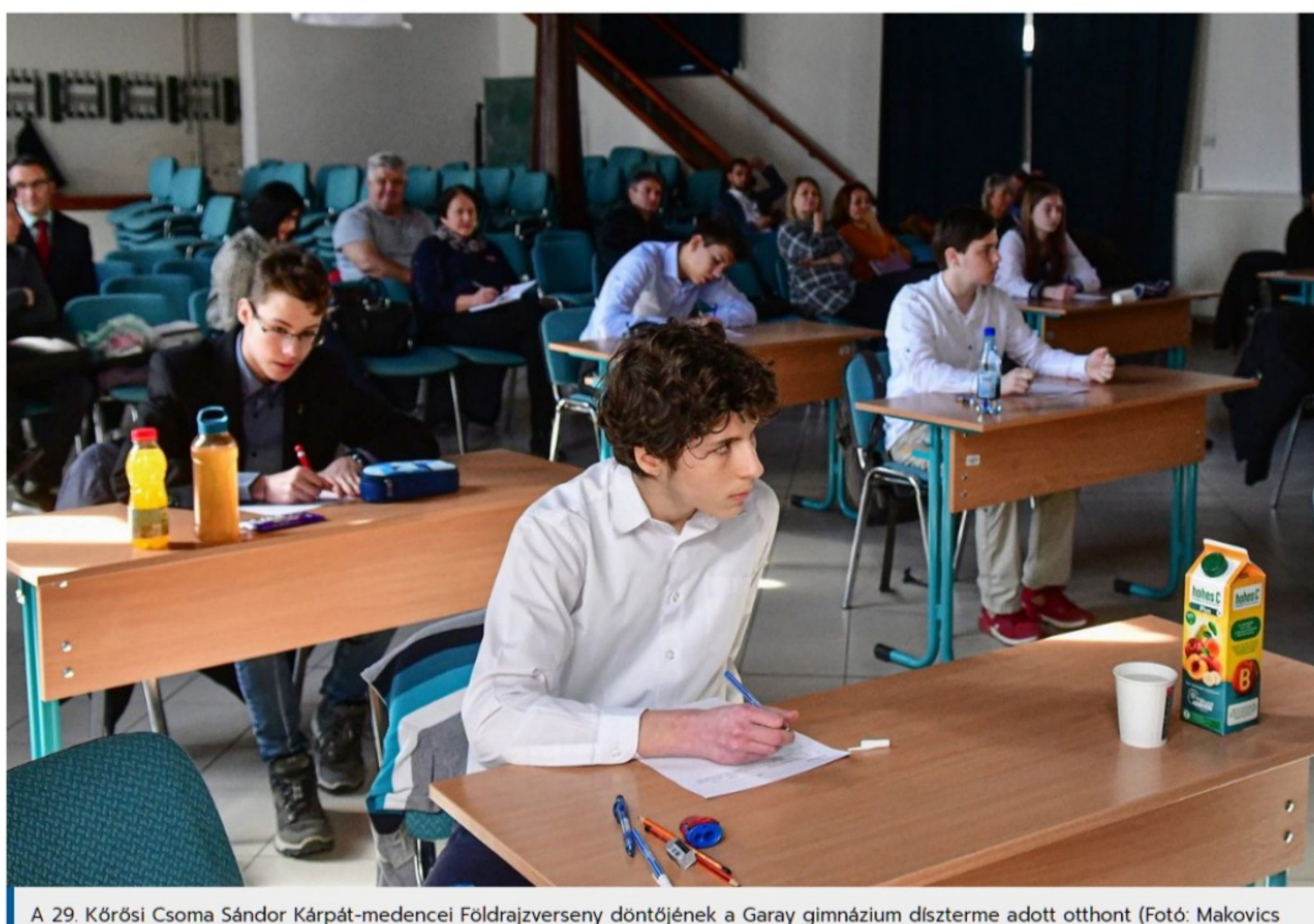
A 29. Kőrösi Csoma Sándor Kárpát-medencei Földrajzverseny döntőjének a Garay gimnázium díszterme adott otthont