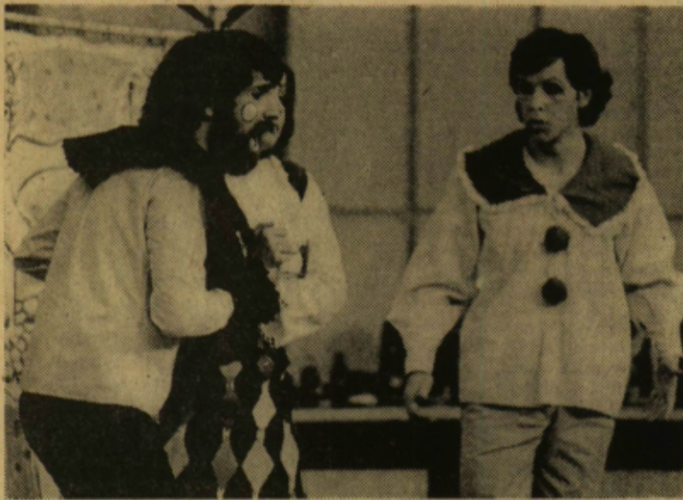
Egy pillanat az operaszínpad egyik előadásáról

Mivel is foglalkozik a művészeti diákkör? Rendkívül érdekes és értékes zenei-történelmi kutatásokat végeznek. A vígopera őse után „nyomoznak”. Régen feledésbe merült intermezzós játékokat, kisoperákat kutatnak fel, ezeket magyarra fordítják, elemzik, le- rövidítik, dramatizálják és előadják — saját elképzelésük szerint.