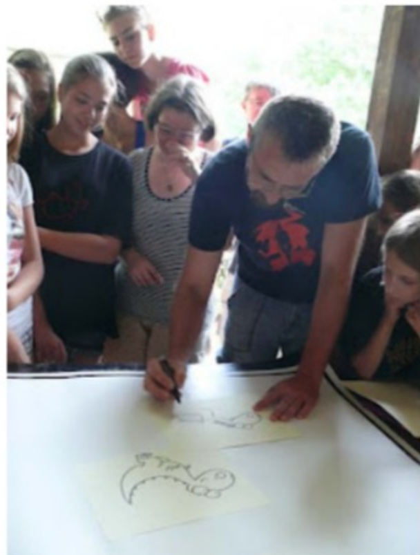
Kármentés