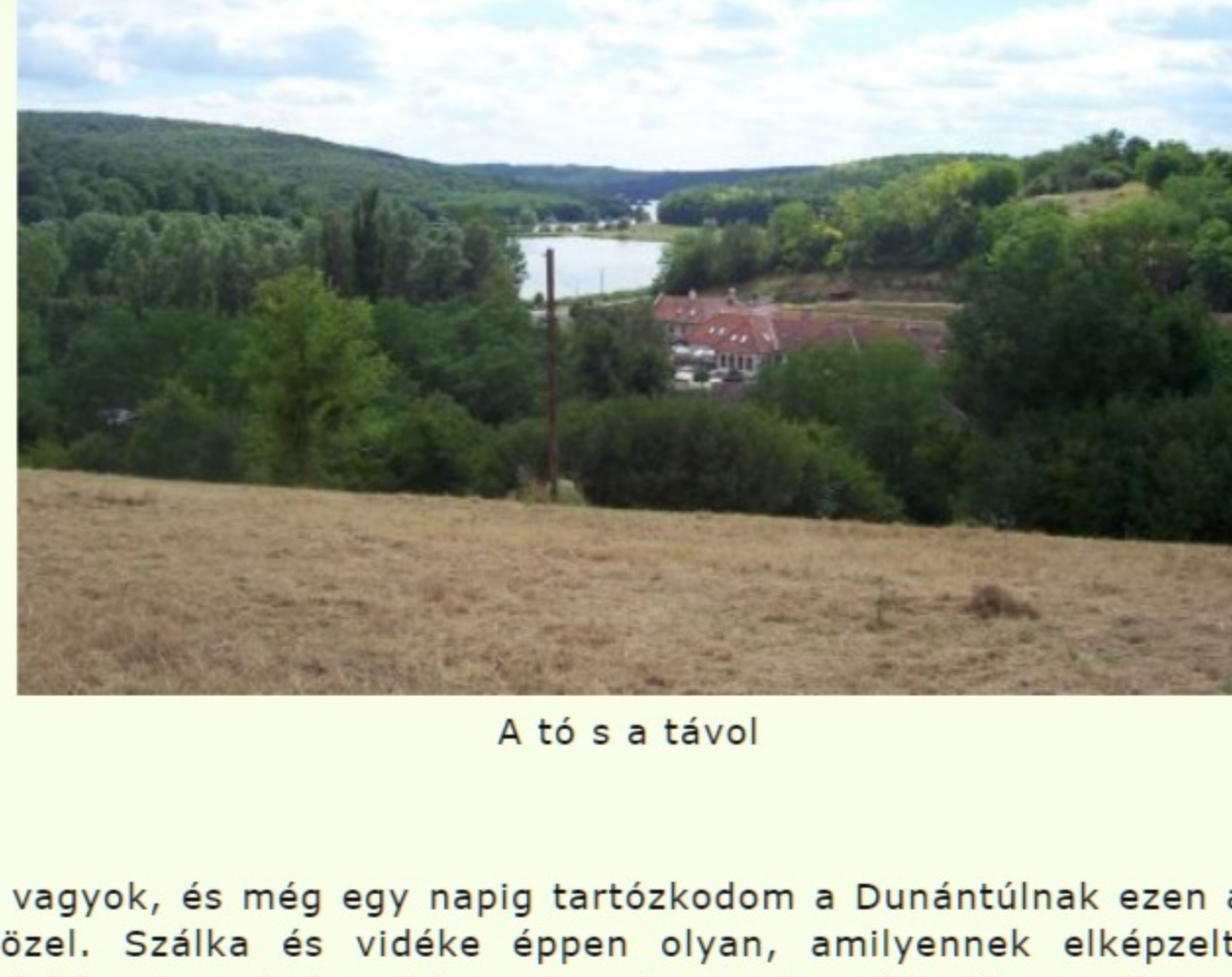
A tó s a távol

Harmadik napja vagyok, és még egy napig tartózkodom a Dunántúlnak ezen a regényes táján, Szekszárdhoz közel. Szálka és vidéke éppen olyan, amilyennek elképzeltem, s a google segítségével feltérképeztem, helyesebben nem olyan: olyanabb. Ahogy rákanyarodtam a község felé vezet útra, jobb felől, a domboldalt sűrűn benőtt fákon és bokrokon túl máris feltűnt, s hosszan mutatta-mutogatta magát a nevezetes szálkai tó, melynek legendáját ezekben a napokban dolgozza ki, s vízi színre drámai előadás és bábjáték formájában egy csapat kisdíák.