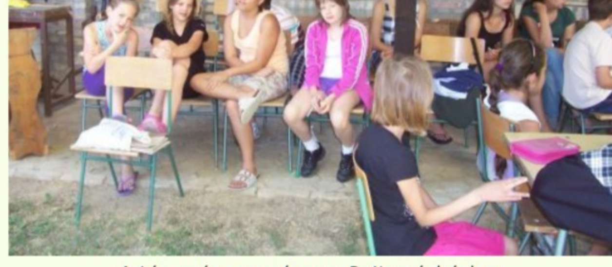
A társaság egy része a Pajtaszínházban

Harmadik napja vagyok, és még egy napig tartózkodom a Dunántúlnak ezen a regényes táján, Szekszárdhoz közel. Szálka és vidéke éppen olyan, amilyennek elképzeltem, s a google segítségével feltérképeztem, helyesebben nem olyan: olyanabb. Ahogy rákanyarodtam a község felé vezet útra, jobb felől, a domboldalt sűrűn benőtt fákon és bokrokon túl máris feltűnt, s hosszan mutatta-mutogatta magát a nevezetes szálkai tó, melynek legendáját ezekben a napokban dolgozza ki, s vízi színre drámai előadás és bábjáték formájában egy csapat kisdíák.