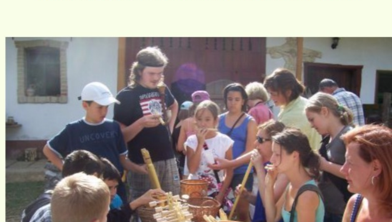
Látogatóban a Tövisháti családnál

Simontornya várának kiállítása nem mászik a vendég arcába, de a belső terem falára aggatott 3D-s képanyag, mely a várépület képzeltetbéli, tehát valóságos alakulástörténetét ábrázolja, olyan időutazásra invitál, amelyre mindenki vágyik, ha legalább egyszer elolvasta A katedrális . Innen már csak pár kilométernyi ugrás a rácegpusztai pusztá, benne Ilyés Gyula és Lázár Ervin első oskolájával. Ezt a néhány ezer métert a lelkes paptanítók száz éve gyalog tették meg hajnalonta, hogy az órák leteltével tépjenek is vissza, mert mindjárt virrad. Szóval kaptam egy kis alföldet. Ilyen helyeken járunk.