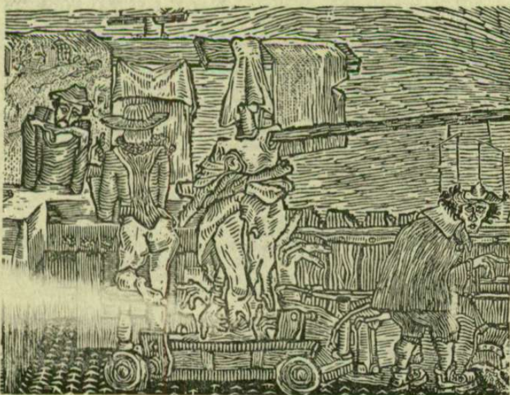
Kereten kívül (részlet)

Ajánlás: Hercegnőm, ki sólyom nélkül vadászol, s tört lelkek álma töled edesül, s erényed bár megcsaltad rég, belül, szüzességedre gyémántként vigyázol; énvelem most már játékból se játszol: kicsúsztam éles karmaid közül!