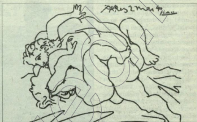
Pablo Picasso rajza