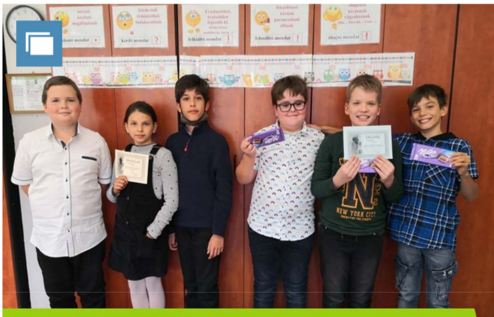
Képgaléria: Baka Istvánra emlékeztek az iskola diákjai