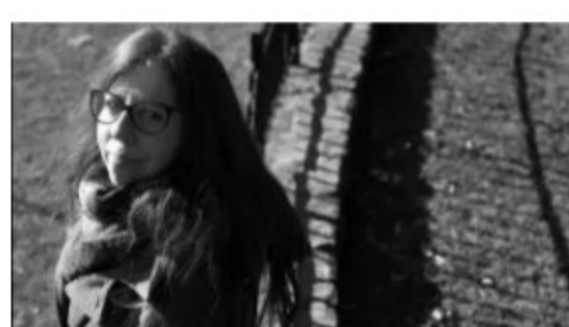
Közelebb vinni a közönséget az alkotásokhoz