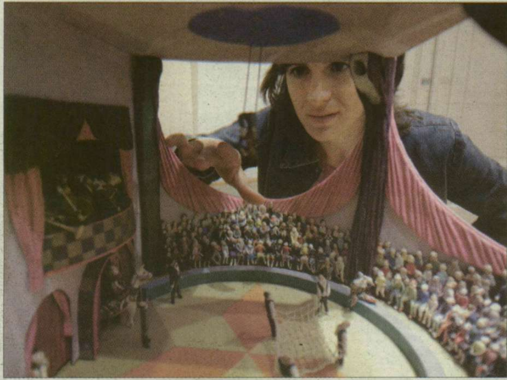
Mint Gulliver. Cirkusz a dobozban