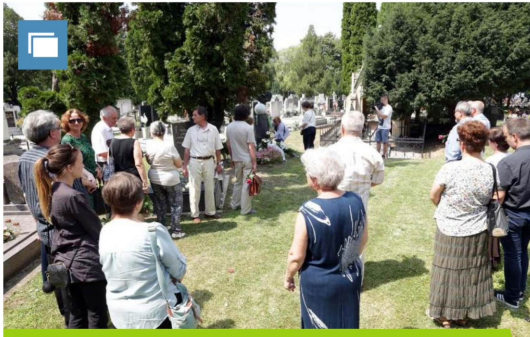
Képgaléria: Megemlékezés Baka Istvánról

Sajnos rövid földi út adatott neki. Szekszárdon született 1948-ban és Szegeden halt meg, 47 évesen, 1995-ben. A Garay gimnáziumban érettségizett, majd a József Attila Tudományegyetemen szerzett magyar–oroszlakos diplomát. Versfordításokkal leningrádi (ma Szentpétervár) ösztöndíjasként kezdett foglalkozni, 1971-ben. Szekszárdi középiskolai tanár volt 1972-74-ig, aztán Szegeden élt és dolgozott. Publikált többek között a Tiszatáj, a Holmi, a Hitel és a Jelenkor című folyóiratokban. Irodalomszervező is volt. Nemcsak arra törekedett, hogy saját műveit elhelyezze, hanem, például a Kincskereső című gyermeklap főmunkatársaként sokakat segített megjelenési lehetőséghez.