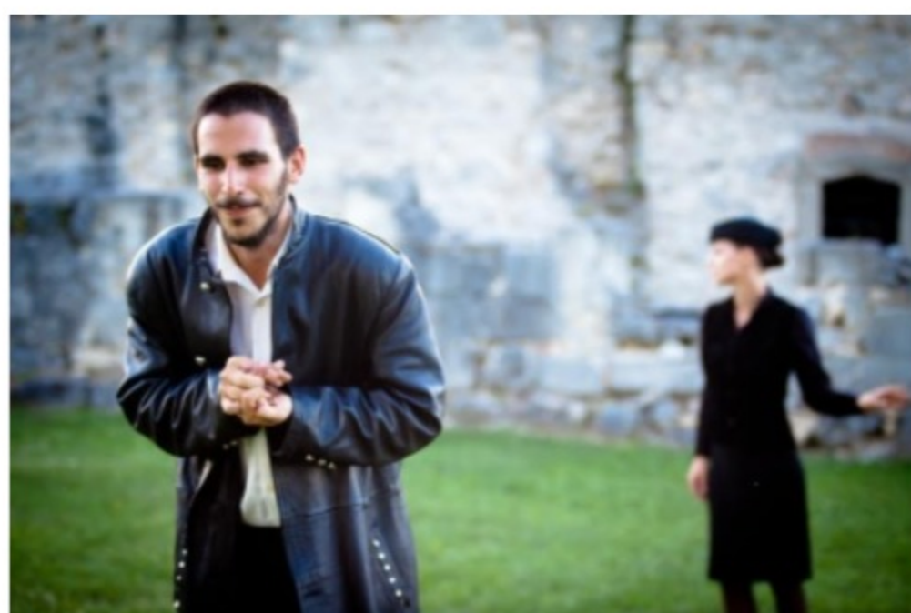
Manna Produkció és a Zsámbéki Színházi Bázis: III. Richárd

A 90 perces előadás a III. Richárd és Isten között feszülő konfliktusra fókuszál, mint a tragédia fő feszültségforrására. Shakespeare remekművén keresztül a magyar, a közép-európai ember alapvető és visszatérő létkérdéseivel – hit, személyiség, hatalom – igyekeznek számot vetni a fiatal alkotók.