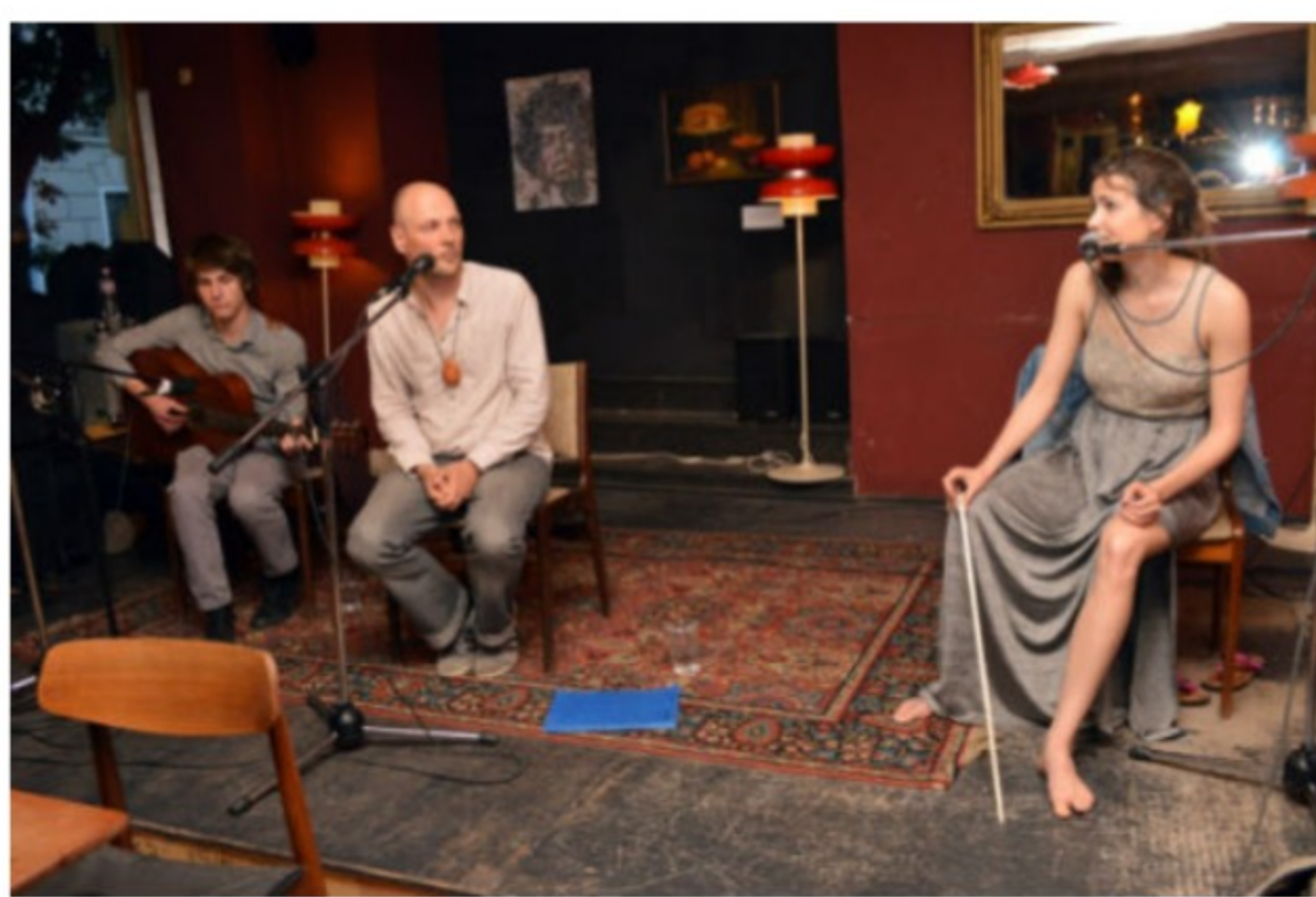
Amargant Színházi Műhely: Völgyvándor