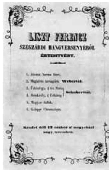
Meghívó a Liszt-hangversenyre