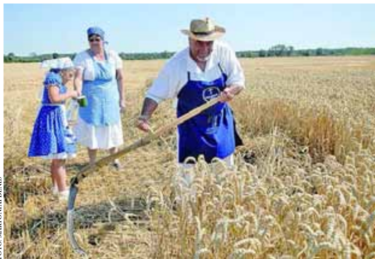
Kaszás, marokszedő és vízhordó kislány a szekszárdi aratónapon