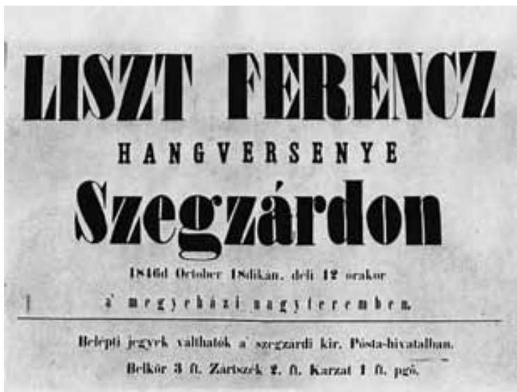
Az első szekszárdi Liszt-hangverseny plakátja

Liszt régi barátja elvesztése miatt érzett fájdalomt ezekben az Ábrányi Kornélhoz írt levelek sorokban juttatta kifejezésre: „Augusz elvesztése a legfájdalmasabban érint. Az esztergomi mise első előadása óta - több mint 20 éve - lélekben egyek voltunk. S ugyancsak ő volt az, aki elhatározásomban, hogy magamat Budapestre kötelezzem, különösen megerősített”.