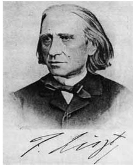
Liszt Ferenc. Eredetije a Zeneművészeti Főiskola Liszt Múzeumában

zonyosnak látszott, hogy Liszt hosszabb időre jön Szekszárdra. „Ezen négy hónap alatt tsak viradhatunk valamire művésztünk érdekében a honatyák segedelmével”. Liszt szekszárdi látogatásának három hónapjában, 1870. október 13-án, a vendéglátó házigazda újabb levélben, már egész világosan határozott formában fogalmazza meg előbbi reménykedését: „Ha majd Liszt Pesten lesz, a külföld itt fogja felkeresni őt, a' most élő művészek főnökét, irányítóját - és ezen fényes központ hazánkban és fővárosunkban fog székelnéni...”